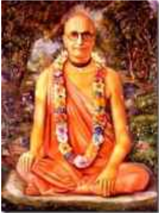
श्रील भक्तिसिद्धान्त सरस्वती गोस्वामी महाराज

कृष्णभावनामृत से सम्पूर्ण जगत को लाभान्वित कराने वाले कार्यक्रम के प्रणेता