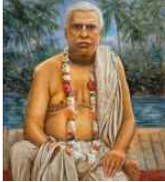
श्रील भक्तिविनोद ठाकुर

श्रील भक्तिविनोद ठाकुर के आध्यात्मिक गुरु