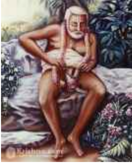
श्रील जगन्नाथ दास बाबाजी महाराज

श्रील भक्तिविनोद ठाकुर के आध्यात्मिक गुरु