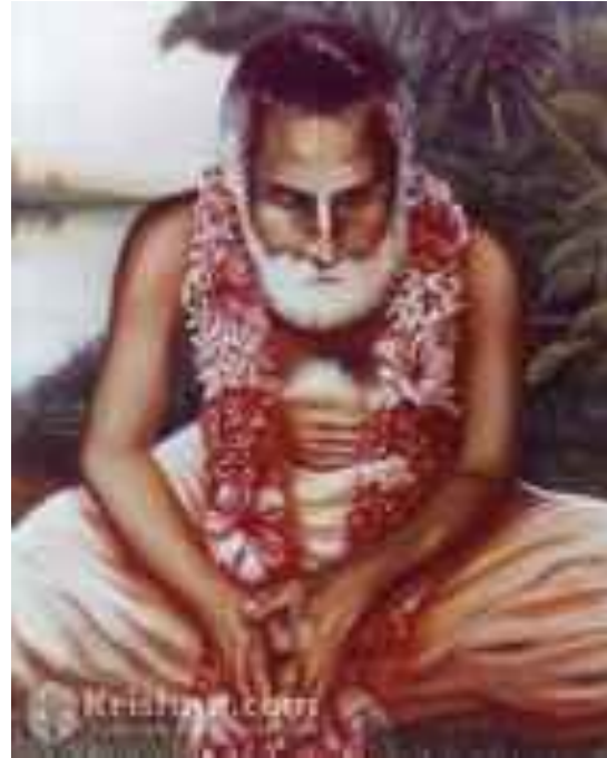
श्रील गौरकिशोर दास बाबाजी महाराज

श्रील. ए. सी. भक्तिवेदान्त स्वामी प्रभुपाद के आध्यात्मिक गुरु